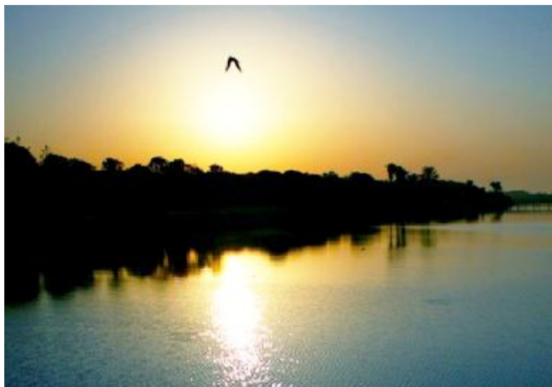
Ffoto: ED :-)