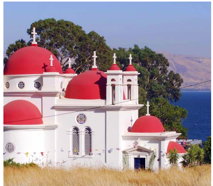
Greek Orthodox church of Capernaum

The Israeli-Palestinian conflict and the presence of holy sites significant to three Abrahamic faiths can be a cause of tension between religious communities. Palestinian Christians in Israel suffer from the same inequalities as the wider Arab population, with higher